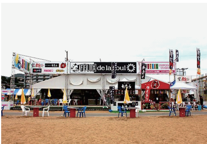
FELIX de la soul 外観