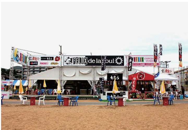
FELIX de la soul 外観