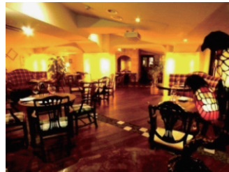
シャンブル・ドット・ハナ 店内