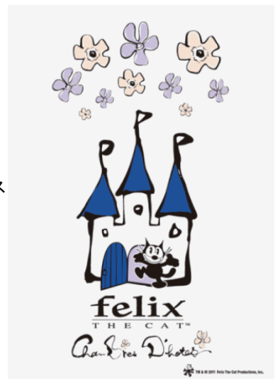
フィリックス × シャンブル・ドット・ハナ コラボロゴデザイン

TM&(C)2011 FELIX THE CAT PRODUCTIONS,INC. Under License